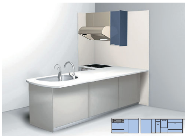
カウンター間口 シンク側 2550mm コンロ側 1889mm 食洗機ありプラン