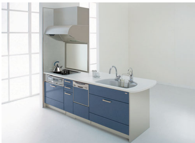
カウンター間口 2550mm 食洗機ありプラン