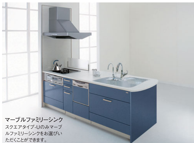
マーブルファミリーシンク スクエアタイプ-Uのみマーブルファミリーシンクをお選びいただくことができます。