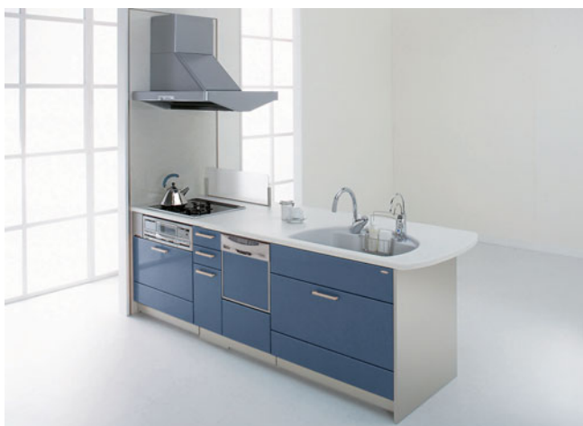
カウンター間口 2550mm 食洗機ありプラン